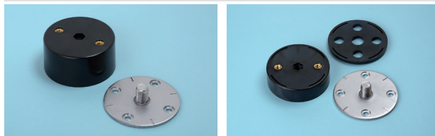
・アジャスターA 47mmタイプ